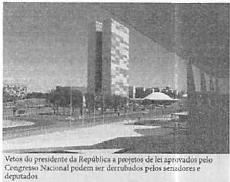
Vetos do presidente da República a projetos de lei aprovados pelo Congresso Nacional podem ser derrubados pelos senadores e deputados

Vinte vetos do presidente Jair Bolsonaro a projetos aprovados pela Câmara dos Deputados e Senado, neste ano e em 2021, serão apreciados na Sessão Conjunta do Congresso Nacional, desta terça-feira (14). Os vetos presidenciais podem ser derrubados ou mantidos. Para derrubar, é necessária a maioria absoluta de votos, ou seja, pelo menos 257 votos de deputados federais, e 41 votos de senadores. Quando não são alcançados esses votos, o veto é mantido.